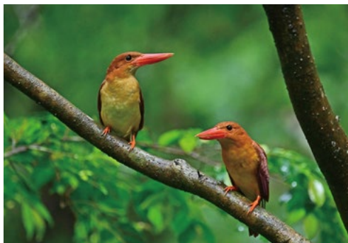
優秀賞「赤翡翠雨乞鳥(アカショウビン)」 山内 清孝