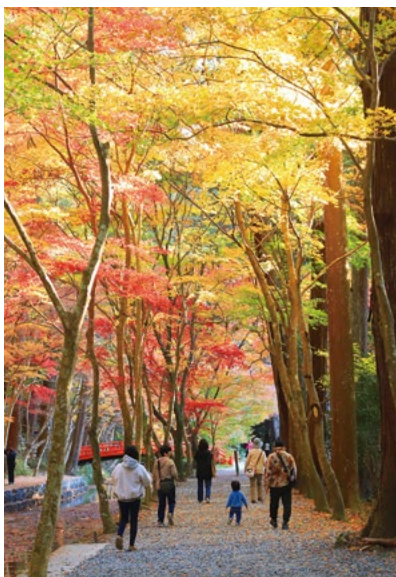
優秀賞「秋好日」 中沢 力男