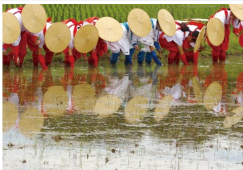
優秀賞「水面に映る早乙女装束」 岩本 雅志